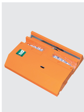
Сканер днища автомобиля