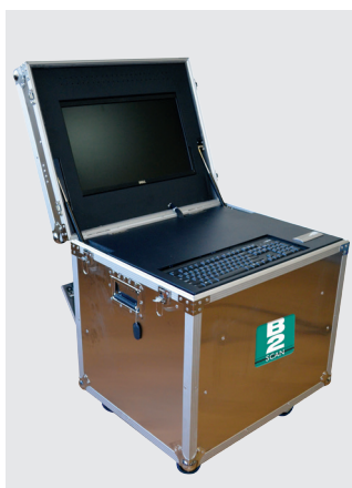
Рабочее место оператора