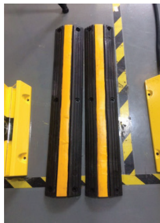
Резиновые полосы зоны торможения