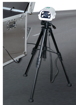
Камера для распознавания номерных знаков